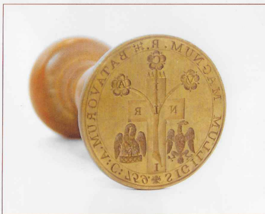
Grootzegel "Der Oppergraden der Vrije Metselarij in de Bataafse Republiek, dezelve Colonieën en Landen", uit 1803

Ze houden zich hoofdzakelijk bezig met het trachten verdieping te geven op de vele vragen die de mythe in het Meester-ritueel onbeantwoord laat. Een aantal van de, op die vragen ontwikkelde rituelen, heeft zich vanuit Frankrijk over de toen bekende maçonnieke wereld verspreid. Eén daarvan is de 'Rite Moderne'.